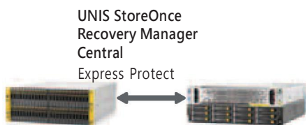
图 3. 通过应用感知、存储集成的数据保护，简化备份和恢复