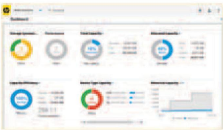
图 2. UNIS 3PAR StoreServ 管理控制台 (SSMC) 仪表板视图最多可提供 16 个任意型号的 UNIS 3PAR StoreServ 阵列的运行健康状况、性能和功能，所有信息均一目了然