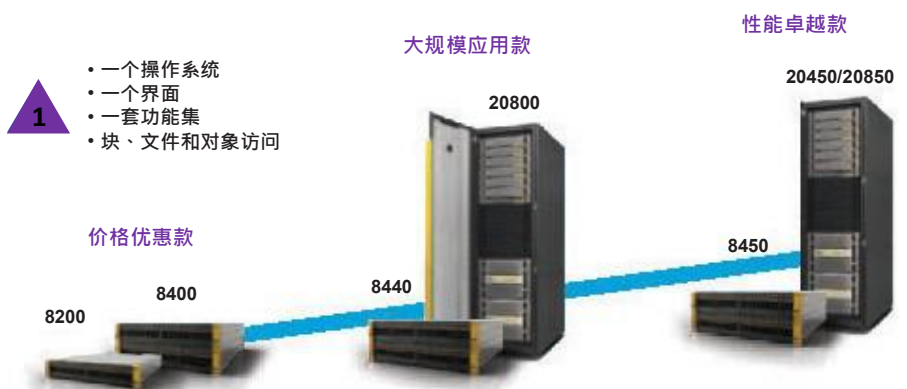
图 1. UNIS 3PAR StoreServ Storage 型号

只需几分钟即可启动和正常运行，而且可以借助服务级别提升和几乎无限制的可扩展性选项来满足混合工作负载要求。管理存储所需时间减少，通过单个界面就可对块、文件和对象进行融合访问。您可以通过一整套持久的技术来保持高可用性，并且可以利用针对 UNIS StoreOnce Backup 设备的扁平备份来实现简单而高效的数据保护。您不必再为了寻求平衡而放弃可扩展的全闪存性能和第 1 层数据服务之类的重要功能。